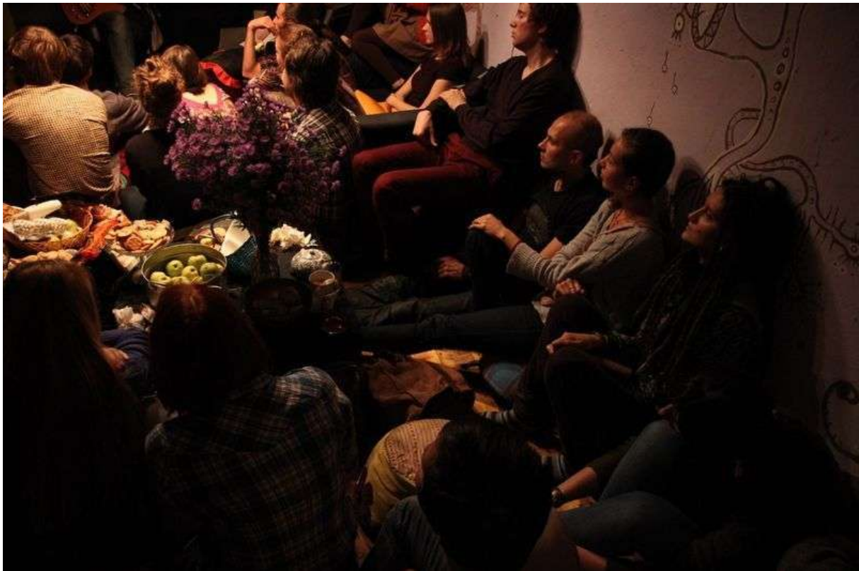
Фотография 3 из 5.