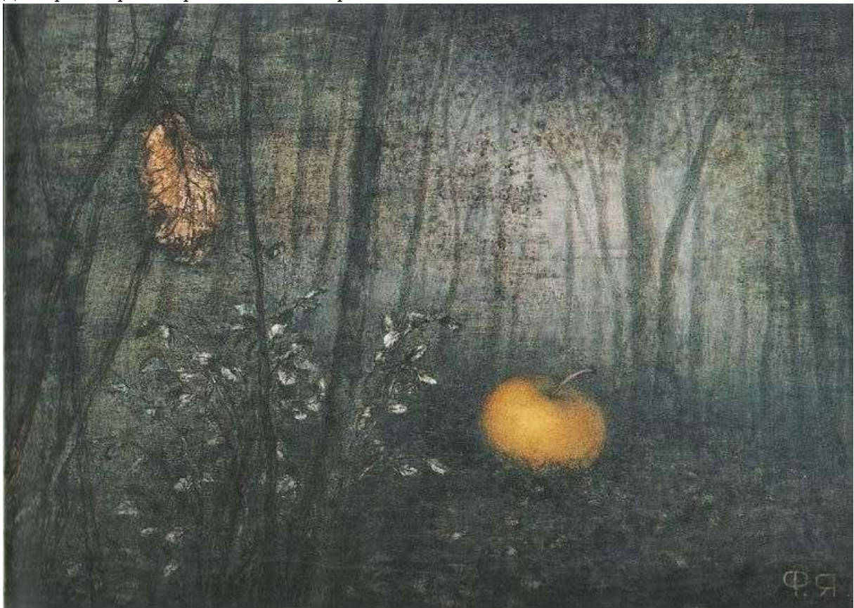
Фотография 5 из 8.