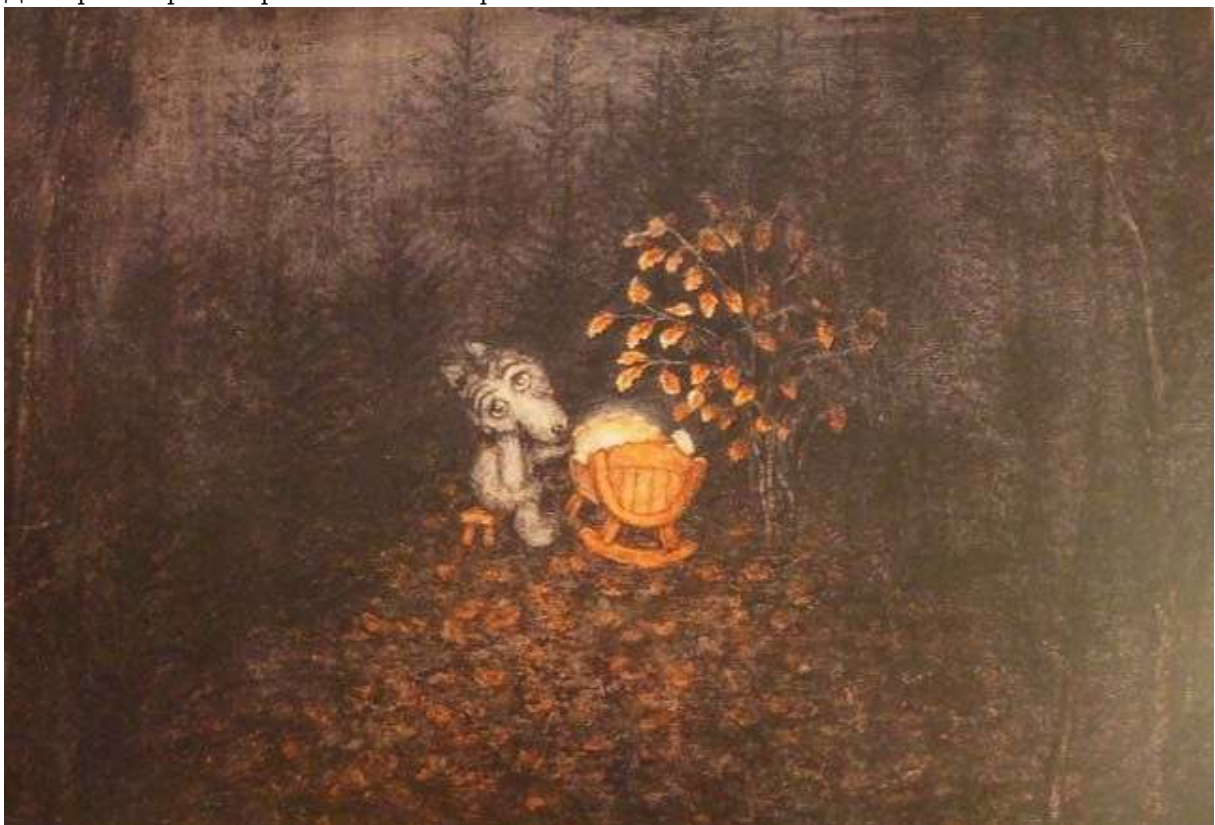
Фотография 2 из 8.