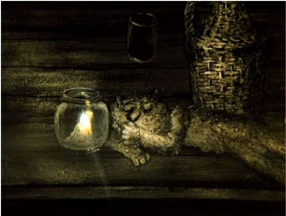
Фотография 1 из 8. Для просмотра галереи нажмите на фото.