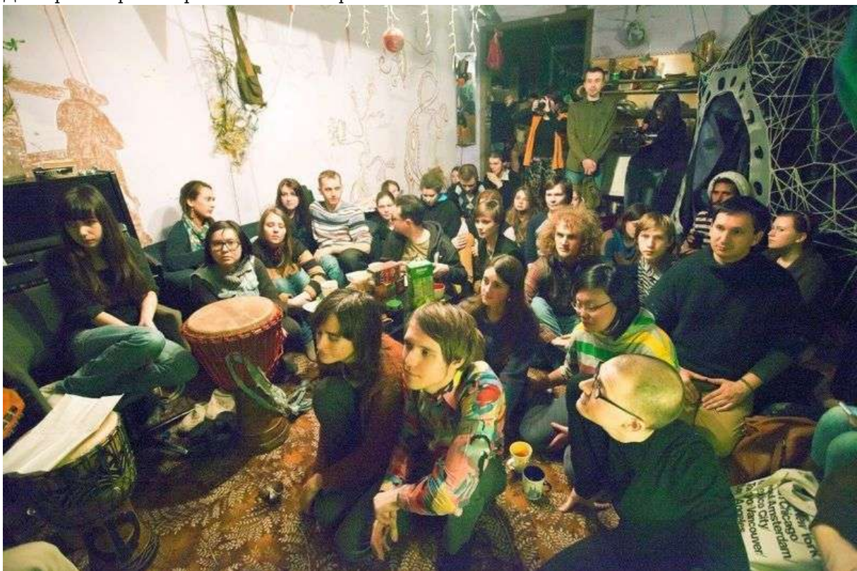
Фотография 4 из 5.