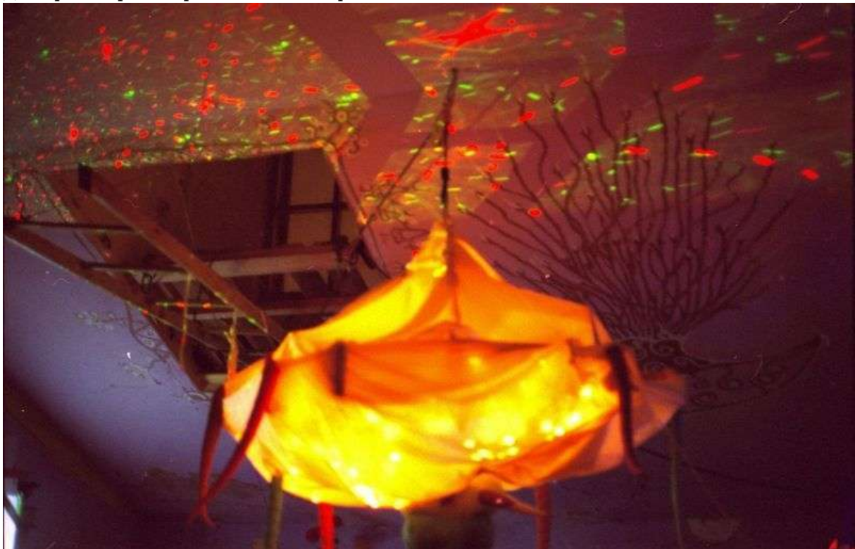
Фотография 2 из 5.