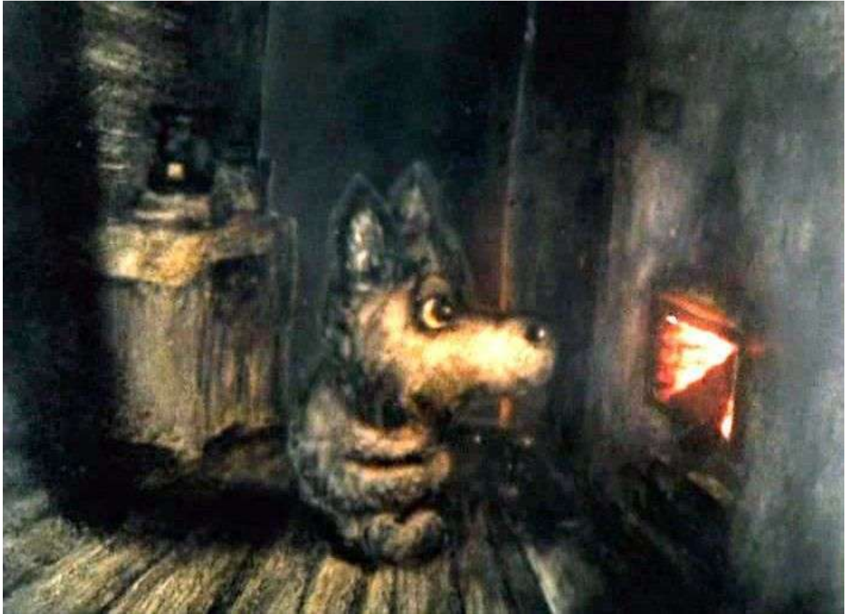
Фотография 4 из 8. Для просмотра галереи нажмите на фото.