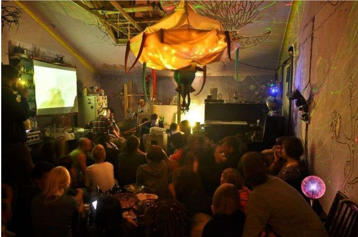
Фотография 1 из 5.